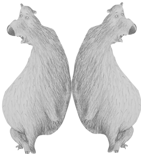
Рисунок Виктора Меламеда