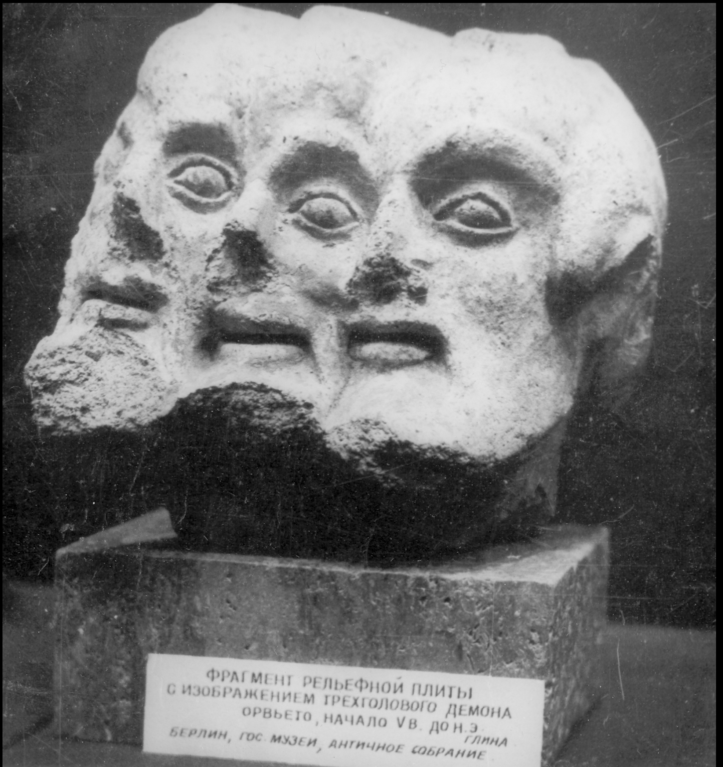
ФРАГМЕНТ РЕЛЬЕФНОЙ ПЛИТЫ С ИЗОБРАЖЕНИЕМ ТРЕХГОЛОВОГО ДЕМОНА ОРВЬЕТО, НАЧАЛО V В. ДО Н.Э. БЕРЛИН, ГОС. МУЗЕЙ, АНТИЧНОЕ СОБРАНИЕ